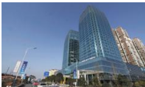
赛伯乐(遂宁)双创中心

走进新时代开创新作为的遂宁经开区,高举新发展理念旗帜,续写着产城相融昂首新跨越的辉煌篇章:以生态文明建设贯穿城市建设始终,以此为引领集聚产业发展新动能,以环境革命为抓手由外而内驱动旧城换新貌……生态为魂,绿色为根。漫漫征途上,遂宁经开区以改革创新勇气和担当奏响了一部“生产”“生活”“生态”三生融合的协奏曲,以产业聚合、功能整合、品质提升为目标,让这里的山、这里的水、这里的人演绎出了新的大城崛起故事,成为助推城市建设提档升级的重要实践之一。