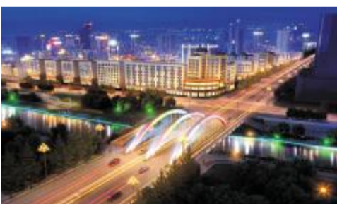
明月桥鸟瞰(效果图)