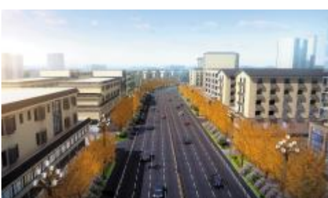
提升改造后的明月路(效果图)