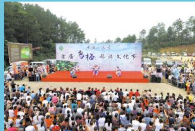
达川首届乌梅旅游文化节