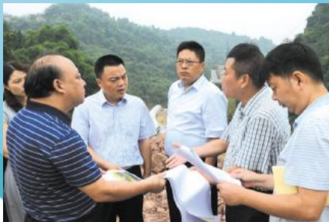
达州市委常委、达川区委书记许国斌(左三),达川区区长向建平(右三)在项目建设现场调研